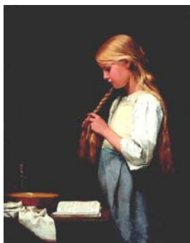
Albert Anker Mädchen die Haare flechtend, 1887 Öl auf Leinwand 70,5 x 54 cm Stiftung für Kunst, Kultur und Geschichte, Winterthur