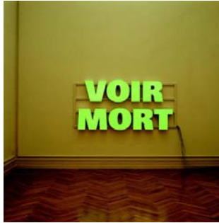
Rémy Zaugg VOIR MORT, 1991 Acrylglas- Leuchtschrift auf Aluchassis, Kabel, 2 Transformatoren 119 x 250 x 13.5 cm Kunstmuseum Bern, Stiftung Kunsthalle Bern