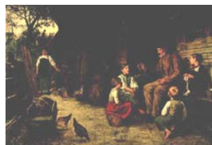
Albert Anker Der Grossvater erzählt eine Geschichte, 1884 Öl auf Leinwand 74 x 109 cm Kunstmuseum Bern, Burggemeinde Bern, Bern