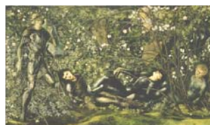
Edward Burne-Jones The Prince entering the Briar Wood, 1869 Oil on canvas 107 x 183 cm Houghton Hall Collection