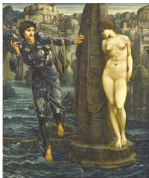
Edward Burne-Jones The Rock of Doom - Der Schicksalsfelsen, um 1876 -1898 Kreide und Deckfarben auf Papier 152 x 137 cm Staatsgalerie Stuttgart