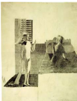
Otto Meyer- Amden Novelle Winkelmann, o.J. Bleistiftzeichnung auf dünnem Papier 27,2 x 21,0 cm Depositum der Gottfried Keller- Stiftung/Kunstmuse- um Bern