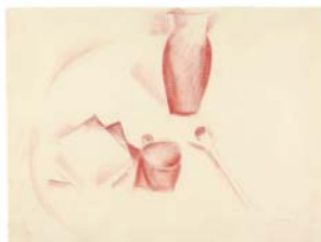
André Derain Nature morte à la pipe, um 1911 Rötél auf Papier 48,0 x 62,8 cm Kunstmuseum Bern, Hermann und Margrit Rupf- Stiftung © 2010, Prolitteris, Zürich