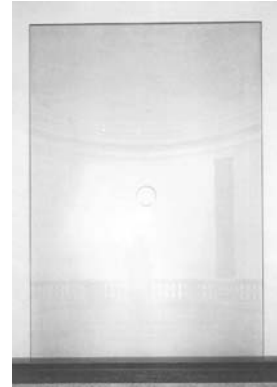
James Lee Byars The looking glass, 1978 Glas, blattvergoldet H 330 cm, B 220 cm, T 1,3 cm Kunstmuseum Bern Sammlung Toni Gerber, Bern Schenkung 1986 © Estate of James Lee Byars