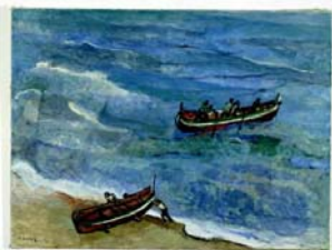
Victor Surbek Fischerboote S. Lucido (Ausfahrt), 1956 Öl auf Leinwand 97,8 x 130,3 cm Kunstmuseum Bern Schenkung aus dem Nachlass Victor Surbek und Marguerite Frey Surbek