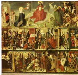
Antwerpen Meister (1490- 1500) Das Jüngste Gericht, die Sieben Werke der Barmherzigkeit, die Sieben Hauptsünden Maagdenhuismuseu m, Antwerpen