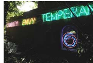
Bruce Nauman Vices and Virtues, 1983-1988 (2008) Neon Schrift, Ansicht der Installation am US_Pavillon, Biennale di Venezia 2009