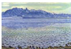
Thunersee mit Stockhornkette , 1904 Öl auf Leinwand, 71 x 105 cm Privatbesitz Le Lac de Thoune et le massif du Stockhorn , 1904 Huile sur toile, 71 x 105 cm Colléction privé Lake Thun with Stockhorn Range , 1904 Oil on canvas, 71 x 105 cm Colléction privé