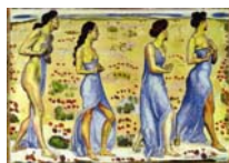
Die Empfindung II , 1901-02 Öl auf Leinwand, 193 x 280,5 cm Privatsammlung L'Emotion II , 1901-02 Huile sur toile, 193 x 280,5 cm Colléction privé Emotion II , 1901-02 Oil on canvas, 193 x 280,5 cm Private collection