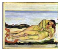
Die Liebe (mittleres Paar) , 1907/08 Öl auf Leinwand, 145 x 175 cm Privatsammlung L'Amour (couple au milieu) , 1907/08 Huile sur toile, 145 x 175 cm Colléction privé Love (Center Couple) , 1907/08 Oil on canvas, 145 x 175 cm Private collection