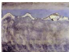
Eiger Mönch und Jungfrau über dem Nebelmeer , 1908 Huile sur toile, 69 x 94 cm Privatbesitz Eiger, Mönch et Jungfrau au-dessus de la mer de brouillard , 1908 Huile sur toile, 69 x 94 cm Colléction privé Eiger, Mönch and Jungfrau above a Sea of Mist , 1908 Oil on canvas, 69 x 94 cm Private collection