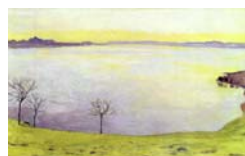
Genfersee von Chexbres aus , 1911 Öl auf Leinwand, 80 x 129 cm Privatbesitz Le Lac Léman, vu de Chexbres , 1911 Huile sur toile, 80 x 129 cm Colléction privé Lake Geneva from Chexbres , 1911 Oil on canvas, 80 x 129 cm Private collection