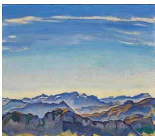
BILD 4 Ferdinand Hodler Die Waadtländer Alpen von den Rochers de Naye aus , 1917 Öl auf Leinwand, 76 x 91 cm Stiftung für Kunst, Kultur und Geschichte, Winterthur