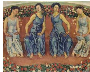
BILD 2 Ferdinand Hodler Heilige Stunde , 1911 Öl auf Leinwand, 187 x 230 cm, Stiftung für Kunst, Kultur und Geschichte, Winterthur