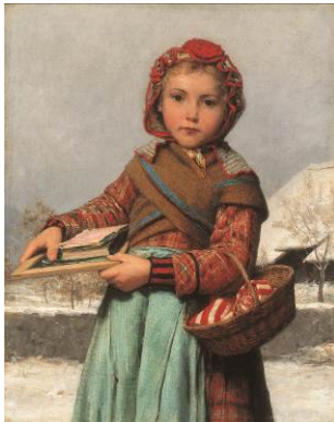
BILD 1 Albert Anker Schulmädchen mit Schiefertafel und Nähkorbchen , 1878 Öl auf Leinwand, 60 x 47,5 cm Stiftung für Kunst, Kultur und Geschichte, Winterthur

Sesam, öffne dich! Anker, Hodler, Segantini... Meisterwerke aus der Stiftung für Kunst, Kultur und Geschichte 07.03. – 24.08.2014