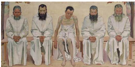
BILD 3 Ferdinand Hodler Die Lebensmüden , nach 1892 Öl auf Leinwand, 110,5 x 221 cm Stiftung für Kunst, Kultur und Geschichte, Winterthur