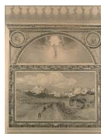
BILD 5 Giovanni Segantini La vita – La natura – La morte , 1898/99 Kohle und Conté-Stift auf Papier, 137 x 108, 137 x 127 und 137 x 108 cm Segantini Museum, Sankt Moritz, Deposita der Stiftung für Kunst, Kultur und Geschichte